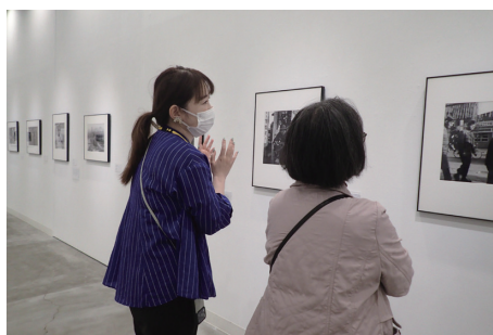
おしゃべりの日@コレクション展