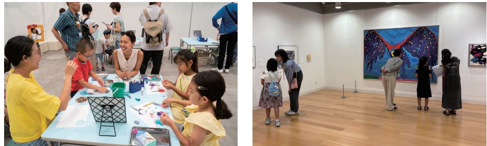
自由参加ワークショップの様子 2025年