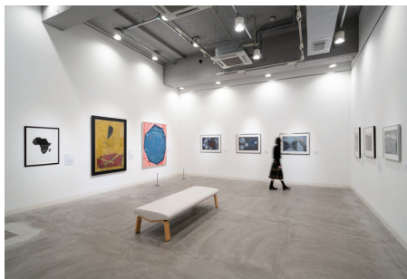
「4.つづく戦後」展示風景