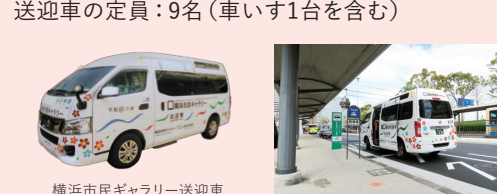
横浜市民ギャラリー送迎車

桜木町駅東口「タクシー降車場」看板隣の「貸切観光バス乗場」看板付近に送迎車が停車します。お身体の不自由な方・高齢者の方に配慮した送迎車サービスです(どなたでもご利用いただけます)。 送迎車の定員:9名(車いす1台を含む)