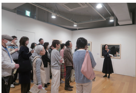
担当学芸員によるギャラリートーク