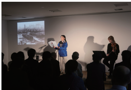
朗読とお話「戦後を生きた女性たち」