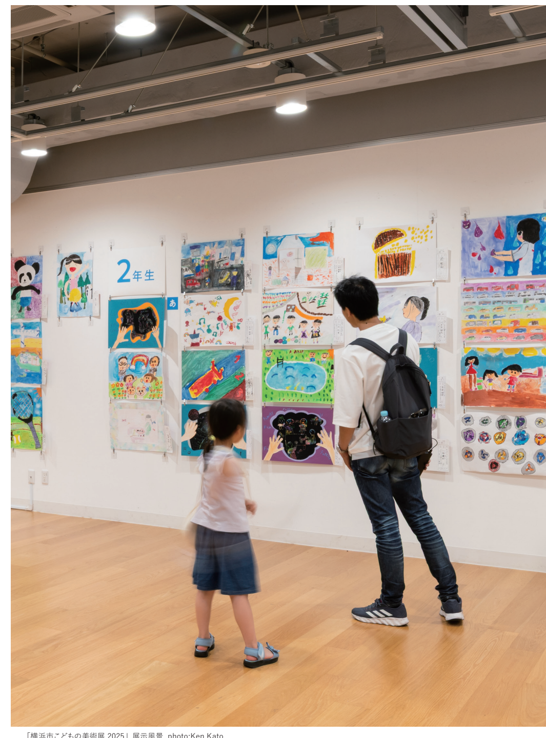
「横浜市こどもの美術展 2025」展示風景