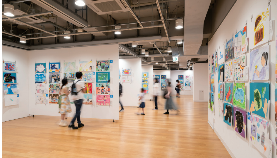
「横浜市こどもの美術展2025」会場風景