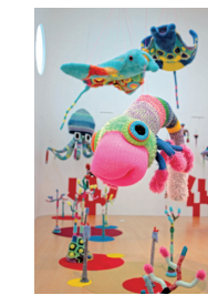
203gow 横浜美術賞美術館 展示の様子 / 2017年

いろんな「あのこ」の、ひみつの場所にあそびによう 夏休みの期間に開催する、子どものための展覧会「あざみ野子どもぎやらい」。20回目の今年は「どこかの、あのこの、すみか。」と題して、3組の作家による作品を展示します。会期中は、会場内で参加できるワークショップイベントもあります。子どもも大人も一緒にあそびに来ることができる展覧会です。