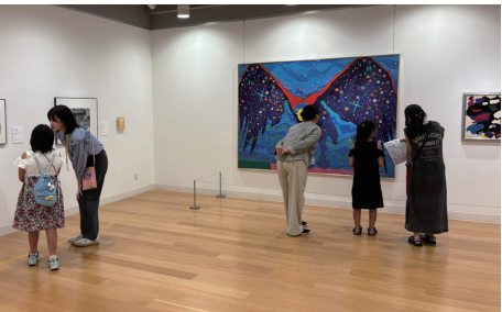
「こどものためのコレクション展」会場風景 2025年