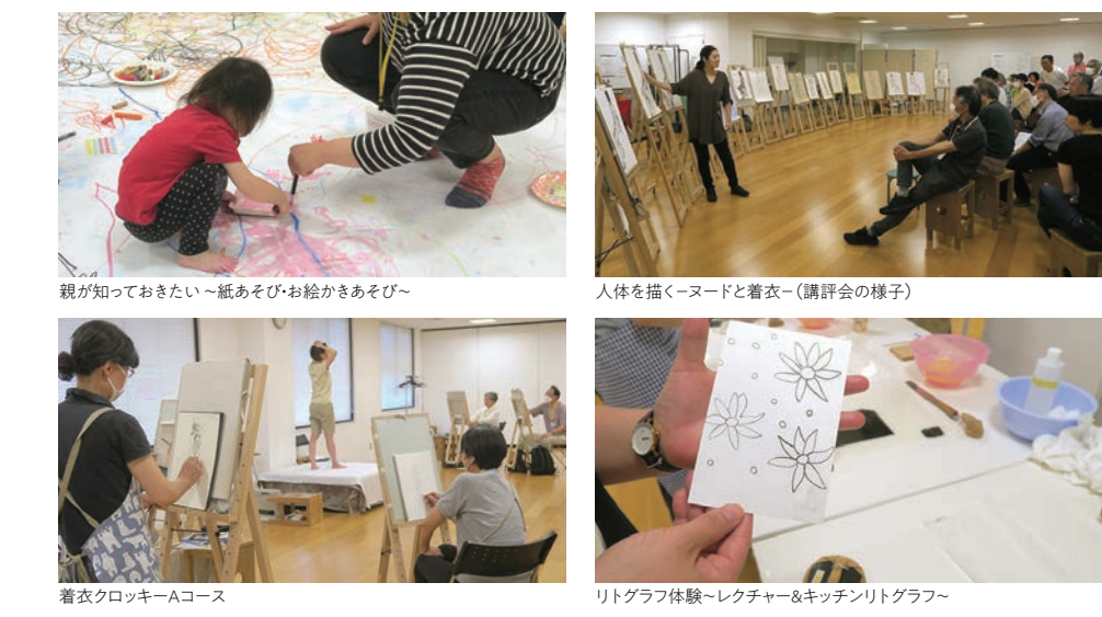
親が知っておきたい~紙あそび・お絵かきあそび~ 人体を描く~ノードと着衣~(講評会の様子) 着衣クロッキー-Aコース リトグラフ体験~レクチャー&キッチンリトグラフ~