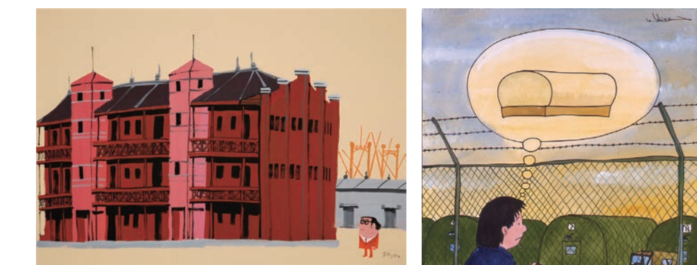
柳原良平《新港埠頭赤煉瓦倉庫》1978年 ガスターカラー、紙 72.2×102.5cm