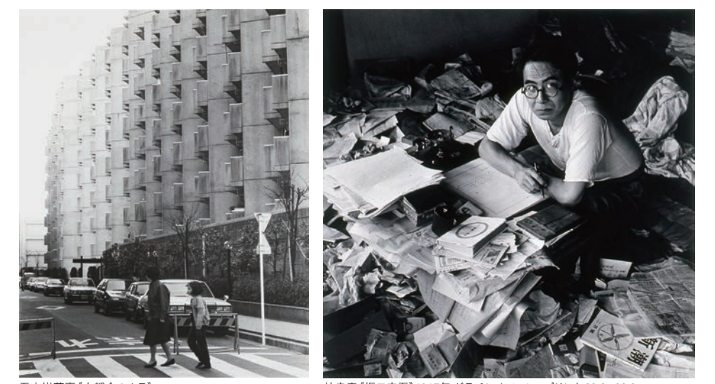
五十嵐英壽(大都会のムラ) 1988年 セラチンシルバープリント 53.4×42.7cm 林忠彦《坂口安吾》1947年 セラチンシルバープリント 23.2×23.2cm

【関連イベント】 ●ワークショップ「絵画の地層、ことばの地層」 言葉遊びや連詩作りを通して自分の言葉の世界を耕し、出品作品の鑑賞体験をより深く豊かにするワークショップです。 2月24日(月)休 13:30~16:30 講師：大崎清夏(詩人) 会場：4Fアトリエ 対象・定員：中学生以上 12名(抽選) 参加費：1,500円 申込締切：2月10日(月)必着 事前申込制(詳細は当館ホームページをご確認ください) ●ハマキッズ・アートクラブ 「横浜市民ギャラリーまるごと探検ツアー」 コレクション展や作品収蔵庫などバックヤードを学芸員と一緒にめぐります。 3月2日(日)10:30~11:40 対象・定員：小学3~6年生 10名(抽選) 参加費：500円 申込締切：2月14日(金)必着 事前申込制(詳細は当館ホームページをご確認ください)