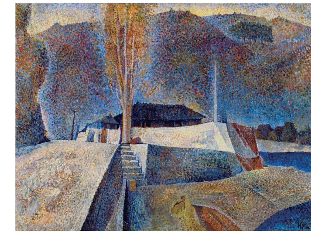
國領経郎《真鶴風景》1967年 油彩、キャンバス 89.2×115.1cm

横浜市民ギャラリーコレクション展2025 コレクションの地層 2025年2月21日(金)~3月9日(日)10:00~18:00(入場は17:30まで) 横浜市民ギャラリー展示室1、B1 入場無料、会期中無休 主催：横浜市民ギャラリー(公益財団法人横浜市芸術文化振興財団/西田装美株式会社 共同事業体)