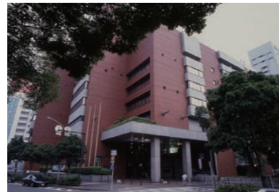
横浜市教育文化センター外観(1988年)