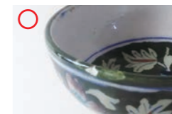
欠けのある陶磁器イメージ