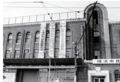
初代横浜市民ギャラリー外観(1966年)