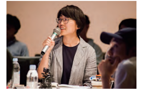
講座イメージ(講師)