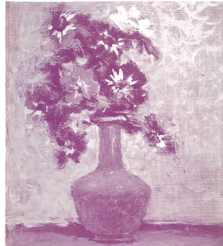
寺田春式「アネモネ」1974年