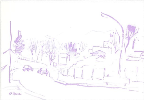
島田四郎「相模野富士」1978年

このたび、横浜市政100周年・瀬谷区制20周年記念「緑と心の祭り」の一環として、美術の粋を集めた横浜市民ギャラリー収蔵作品巡回展が開催され、区ゆかりの作家の作品を含め、瀬谷区民の皆様との身近で鑑賞する機会が得られましたことは大変喜ばしいかぎりです。