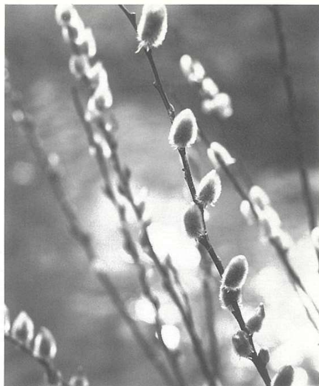
「ねこやなぎ」 入江泰吉