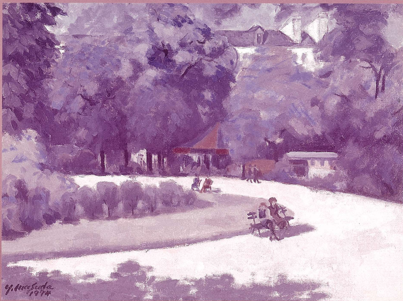
「巴里小公園」 益田義信

横浜市神奈川区富家町1-3 ☎045-432-3399 市営バス東神奈川駅西口徒歩1分 JR東神奈川駅下車徒歩4分