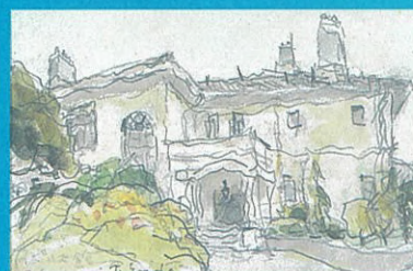
イギリス館 遠藤典太 1979年 15.4×23.6cm 鉛筆・水彩・紙