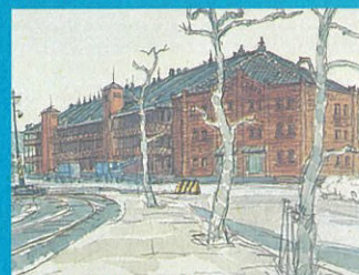
赤煉瓦倉庫 安保建二 1979年 29.8×39.6cm 鉛筆・水彩・紙