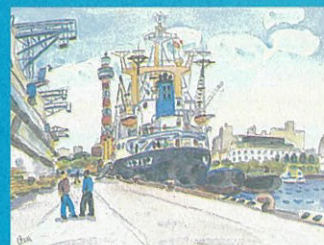
山下埠頭 市川 勉 1979年 31.0×37.2cm 鉛筆・水彩・紙