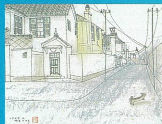
山手通り 宮本昌雄 1979年 30.2×40.0cm パステル・インク・紙