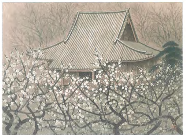
入江正巳「春光、三溪園燈明寺本堂」1988年