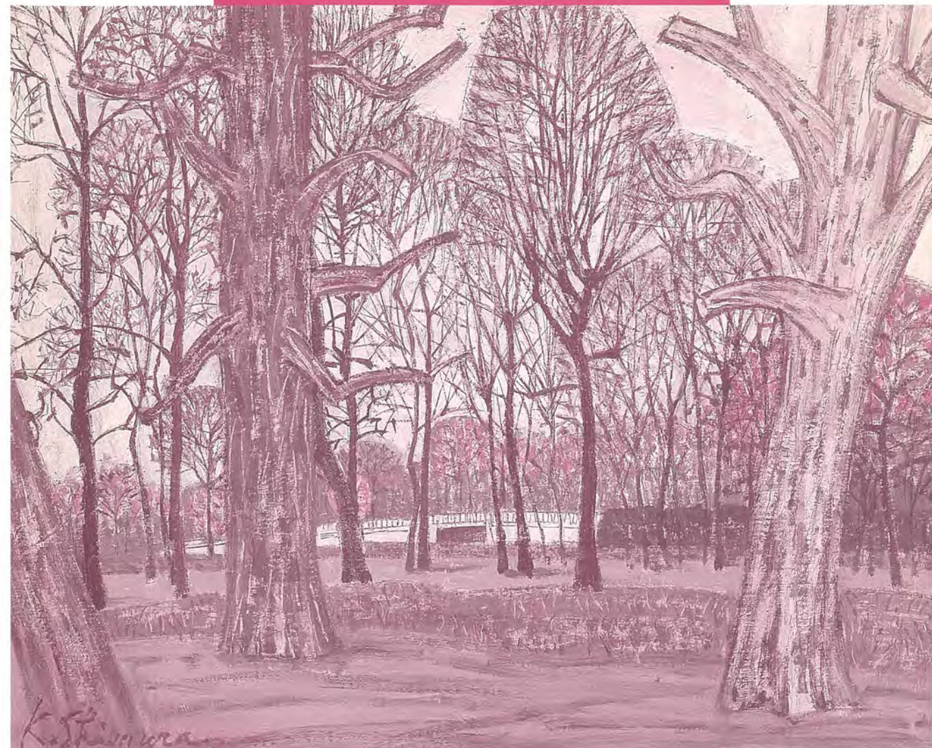
志村計介「チューレリー公園」1955年