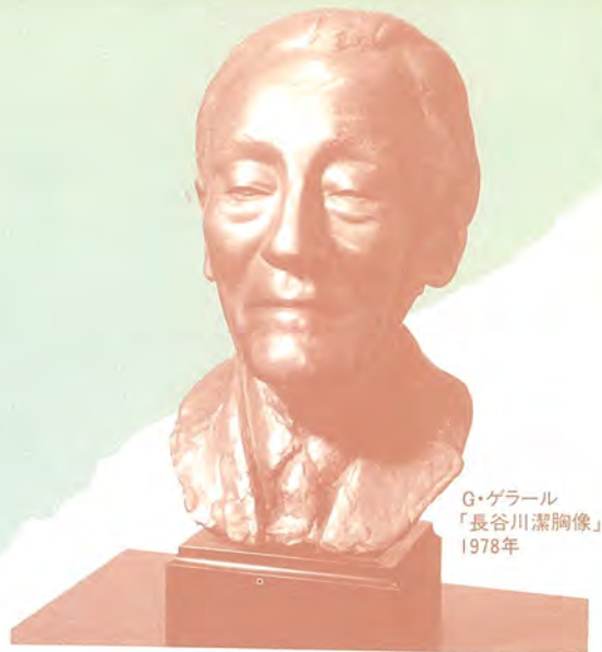
G・ゲラール 「長谷川潔胸像」 1978年

市民ギャラリーの25年間にわたる活動の足跡と戦後の“ハマの美術界”の動向の記録ともいえるこれらの作品をご鑑賞いただければ幸いです。