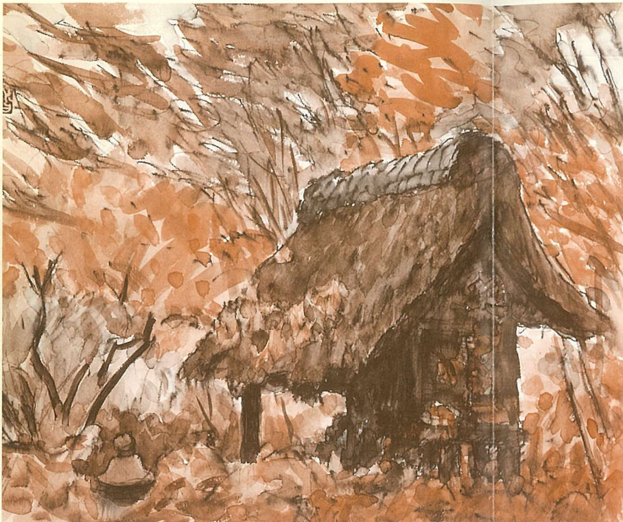
「古祠新緑(金沢文庫)」 猪瀬 踏花