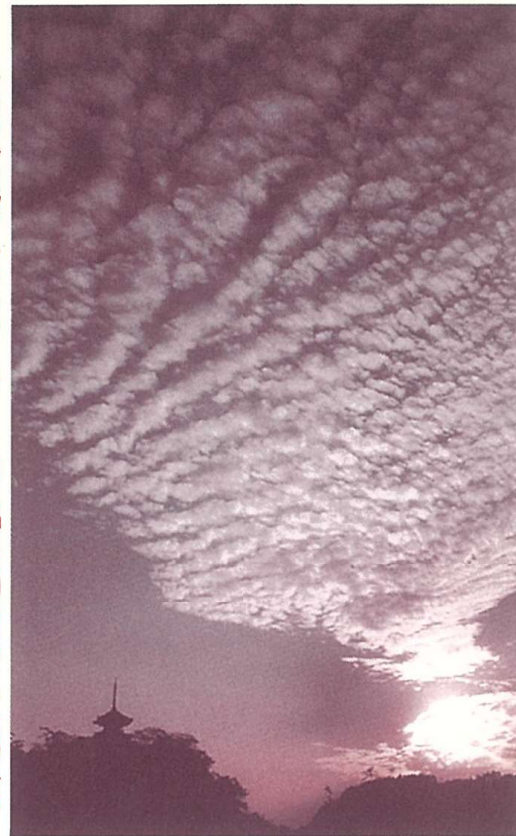
「三溪園暮色」浜口タカシ