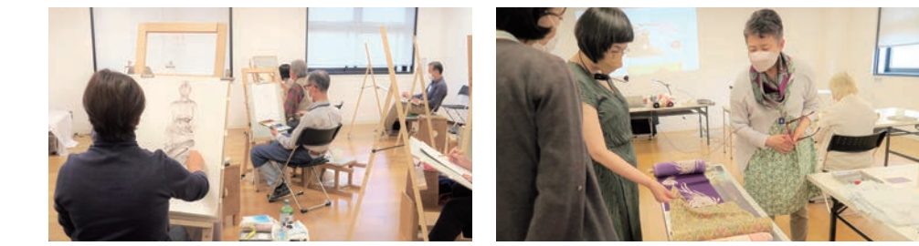
着衣クッキー 着物をほどこ