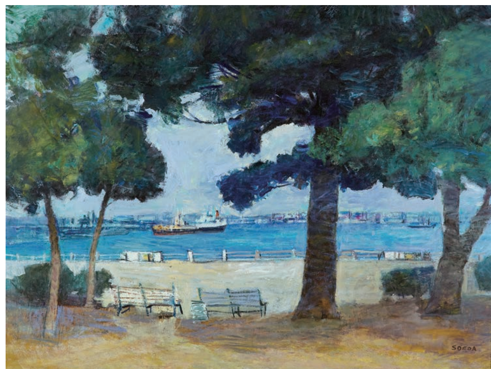
添田定夫《春光の横浜港》1988年 油彩、キャンバス 97.2×130.2cm

【関連イベント】 ●おしゃべりステーション@コレクション展 作品を見て感じたことを鑑賞サポーター(ボランティア)とお話ししませんか?おすすめ作品の紹介も随時行います。 2月26日(日)、3月4日(土) 各日13:30～15:30 会場：1階展示室前スペース、展示室1-B1 参加無料、申込不要 ●ハマキッズ・アートクラブ 「横浜市民ギャラリー—まるごと探検ツアー」 コレクション展や作品収蔵庫などバックヤードを学芸員と一緒にめぐります。おみやげニワークショップも。 3月5日(日)10:30～12:00 対象・定員：小学3～6年生 8名(抽選) 参加費：1,000円 申込締切：2月14日(火) 必着 事前申込制(詳細は当館ホームページをご確認ください) ※新型コロナウイルス感染拡大状況等により、展示会および関連イベントに変更が生じる場合があります。ご来場前に必ず当館ホームページまたは電話で最新情報をご確認ください。 ●学芸員によるギャラリートーク 学芸員が展示会の見どころをご紹介します。 3月4日(土)11:00～11:30 会場：展示室1-B1 参加無料、申込不要