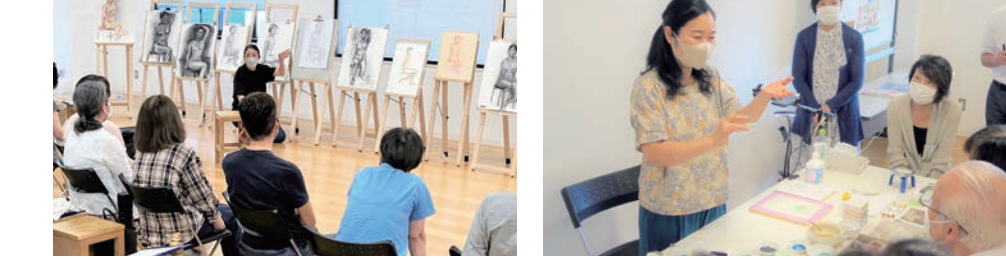
人体を描く—ヌードと着衣—(講評会の様子) はじめての日本画 絹に描く—若冲の彩色に学ぶ—