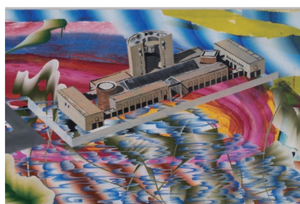
《恋と壁》(部分)2022年 パネルに綿布、ジェツ、アクリル