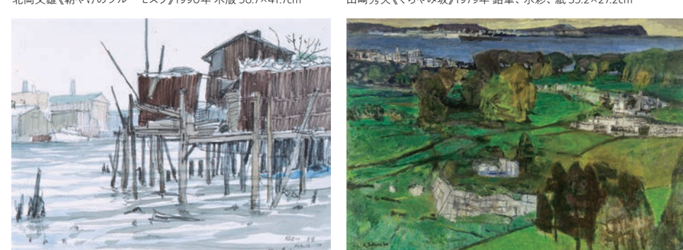
安保健二《漁船の棧橋(鶴見川下流・生妻)》1979年 鉛筆、水彩、紙 24.1×32.4cm 櫻庭彦治《横浜・山手(外人墓地と港)》1963年 油彩、キャンバス 111.8×161.3cm