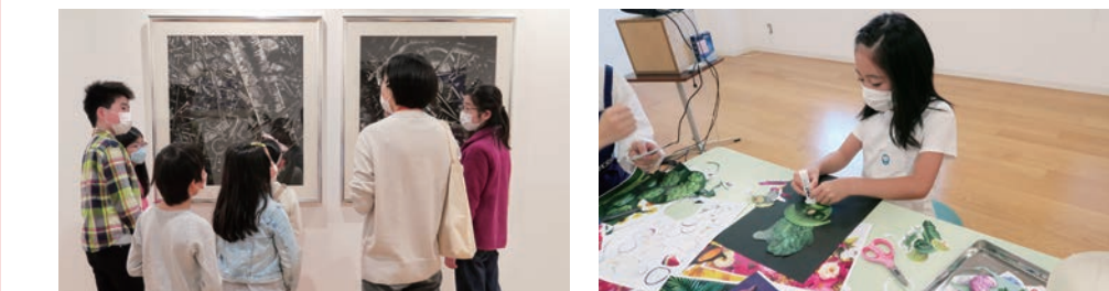
横浜市民ギャラリー—まるごと探検ツアー 切り絵で顔をカラージュしよう