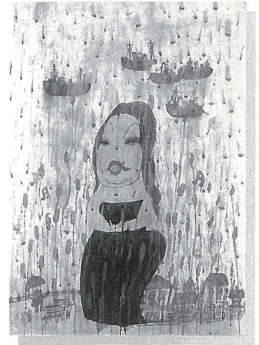
イワタ タケオ 「雨のブルース」昭和53年