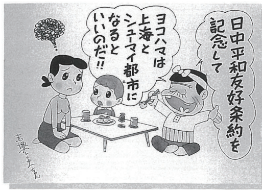
赤塚不二夫 「国際都市横浜」昭和53年