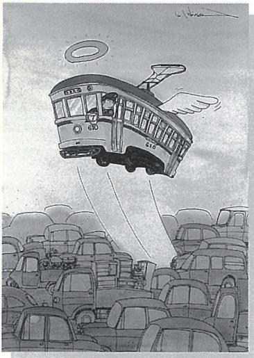
ヒサクニヒコ 「市電廃止 (昭和41年~47年春) [開通明治37年7月 神奈川-大江橋間]」 昭和53年