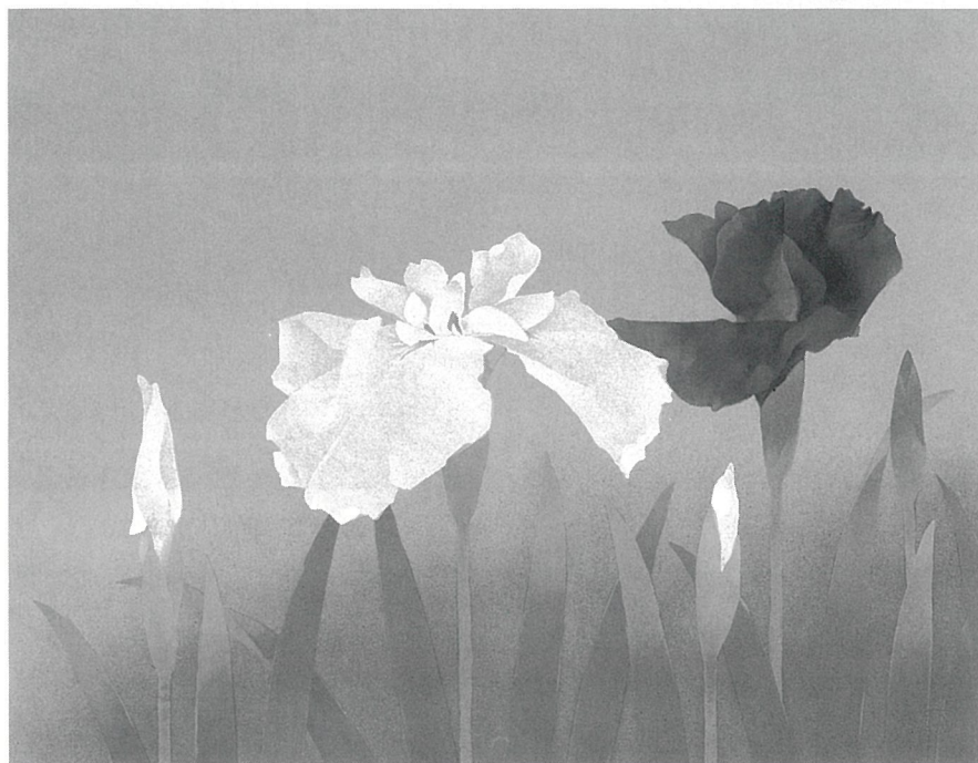
松本勝「菖蒲」リトグラフ 40.9×53.0 cm 1992年