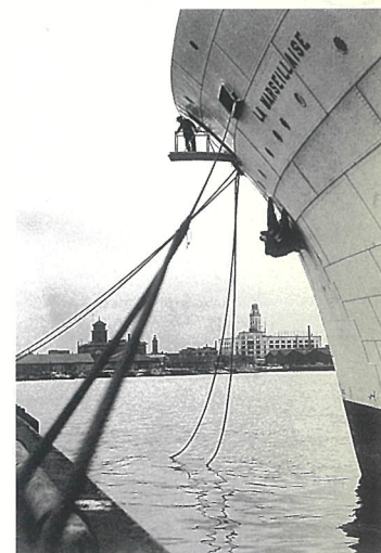
五十嵐英壽「ハマの三塔・キング(県庁) クイーン(税関)ジャック(開港記念会館)」 写真 1953年