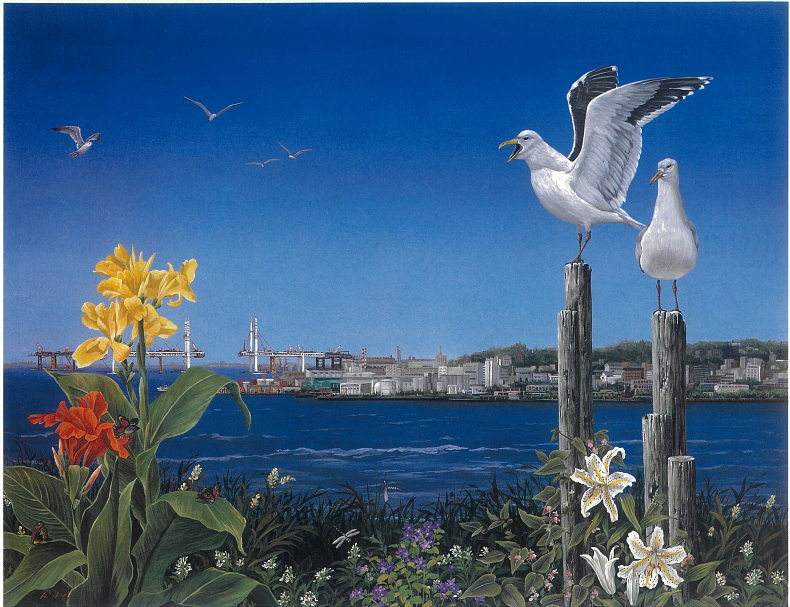
北久美子「1988年 夏」油彩画 91.0×116.8cm 1988年