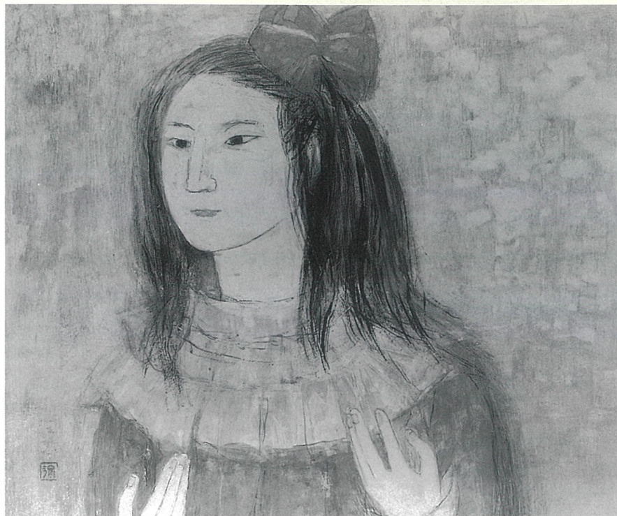
岡本彌壽子「祈り」紙本着彩 45.5×53.0 cm 1988年

海と緑の丘のある港町ヨコハマ——、 一つの作品がうまれる背景には様々な 動機があります。近年の横浜市民ギャ ラリー収蔵作品の油彩画、日本画、版 画、写真の中から横浜と磯子ゆかりの 作家と作品を選んで御紹介いたします。 懐かしい横浜、未来に広がるイメージ など、美術作品をとおして、心ゆくま でご鑑賞ください。