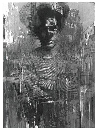
高橋薫「Melancholia '92-A」エッチング、写真、 コラージュ 180.0×130.0 cm 1992年