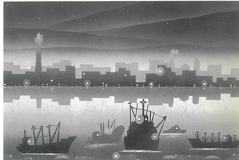
西田知子「夕ぐれ」木版画 47.0×67.0 cm 1988年