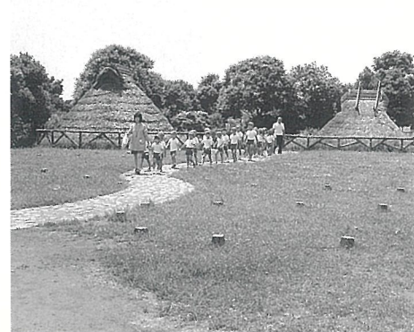
園木健市「初夏の三殿台」写真 1988年