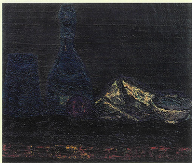
兵藤和男「海と山のある静寂」1956年 油彩・キャンバス

実在の奥なる清光を求めて 戦後ヨコハマに交差した二つの異彩 青春昂揚の一九五〇―六〇年代