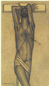
山中春雄「聖セバスチャン」1956年 鉛筆・紙 横浜美術館所蔵 吉川悦次寄贈

実在の奥なる清光を求めて 戦後ヨコハマに交差した二つの異彩 青春昂揚の一九五〇―六〇年代