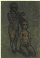
山中春雄<髪>1958年 油彩・キャンバス 横浜美術館所蔵