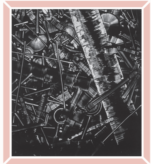
一原有徳 (SON 88) 1988年 / アルミニウム版モノタイプ / 90.5×81.5cm

●本作品は「横浜市民ギャラリー 2022 モノクローム - 版画と写真を中心に」(2022年2月25日～3月13日、横浜市民ギャラリー展示室1、B1)に出品されます。