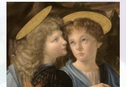
《模写 ヴェロッキオ工房作『キリストの洗礼』》2009年 テンペラ、油彩 ※図版いずれも塩谷亮