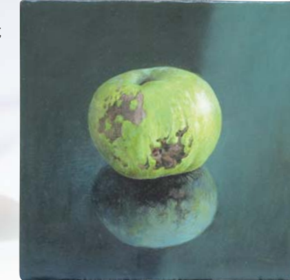
椿暁子《木瓜の実》2010年 テンペラ、油彩