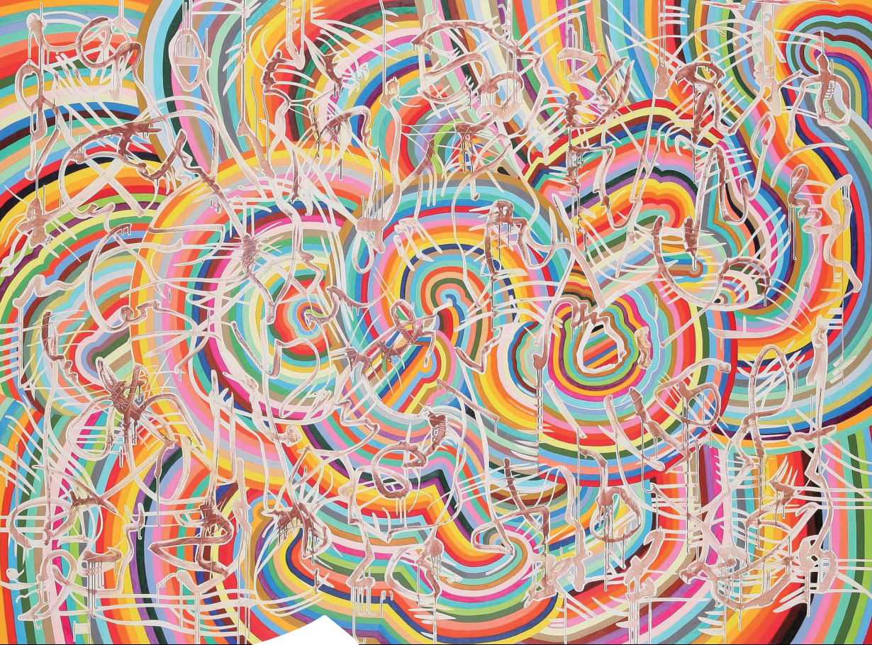
石山朔(無題) / 2000年 / 油彩、キャンバス / 248.5×333.3cm @石山朔 & S.A.K.U.Project