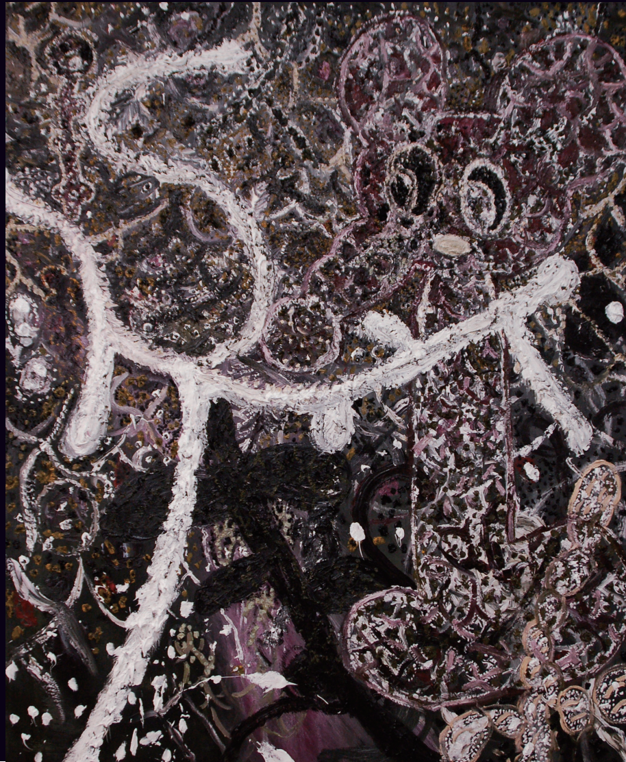
赤羽史亮(輝く暗闇(オオネズミタケ)) / 2009年 / 油彩、キャンバス / 194.0×162.0cm