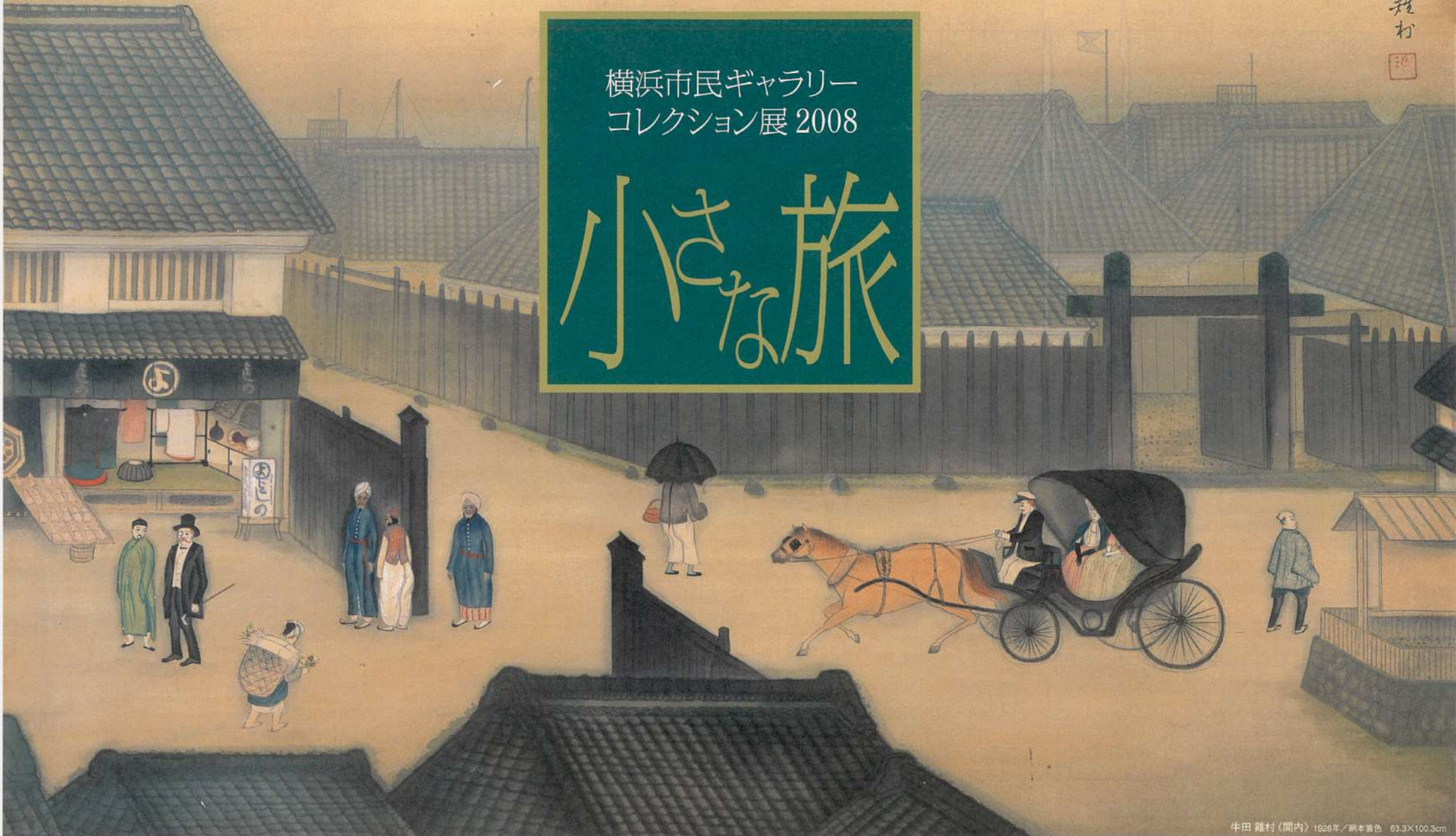
牛田 雑村《関内》1926年／絹本着色 63.3×100.3cm

横浜市民ギャラリー 2|27[水]→3|23[日] 2008 [3階 C展示室 入場無料]