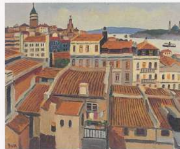
市川 勉〈ボスポロス海峡を臨む〉 1976年/油彩、キャンバス 60.8×72.5cm