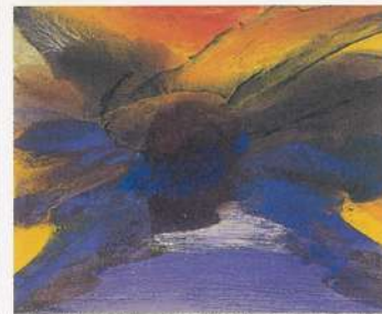
江見絹子〈水尾〉 1974年/油彩、キャンバス 79.0×99.0cm