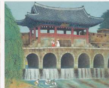
入江正巳〈華虹門〉 1973年/紙本着色 81.0×101.0cm