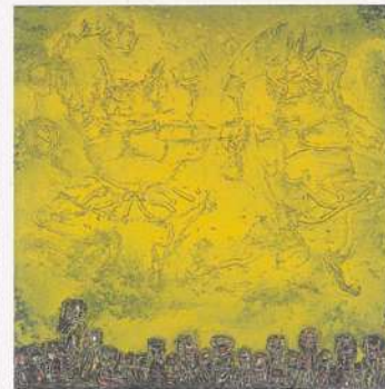
田澤茂〈夏物語〉 1984年/油彩、キャンバス 163.0×163.0cm