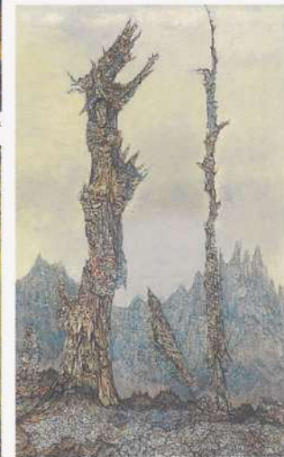
平野杏子〈春林天〉 1981年/油彩、キャンバス 129.0×79.0cm