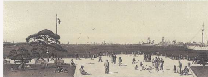
相笠 昌義〈山下公園の日曜日〉 1988年/エッチング 28.0×72.0cm