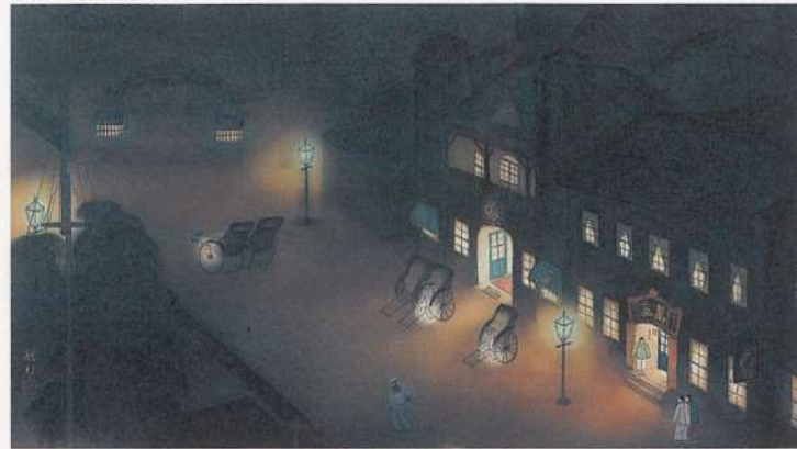
牛田豊村〈蕨街の夕〉「蟹港二題」より 1926年/絹本着色 63.0×113.0cm