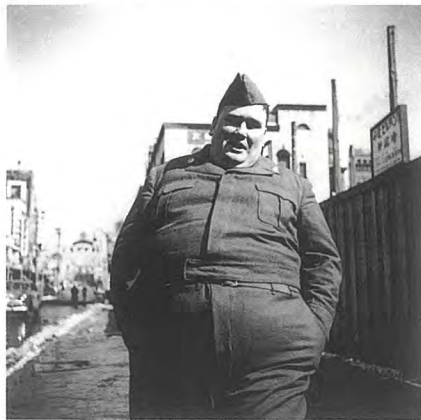
奥村泰宏「伊勢佐木町」昭和27年