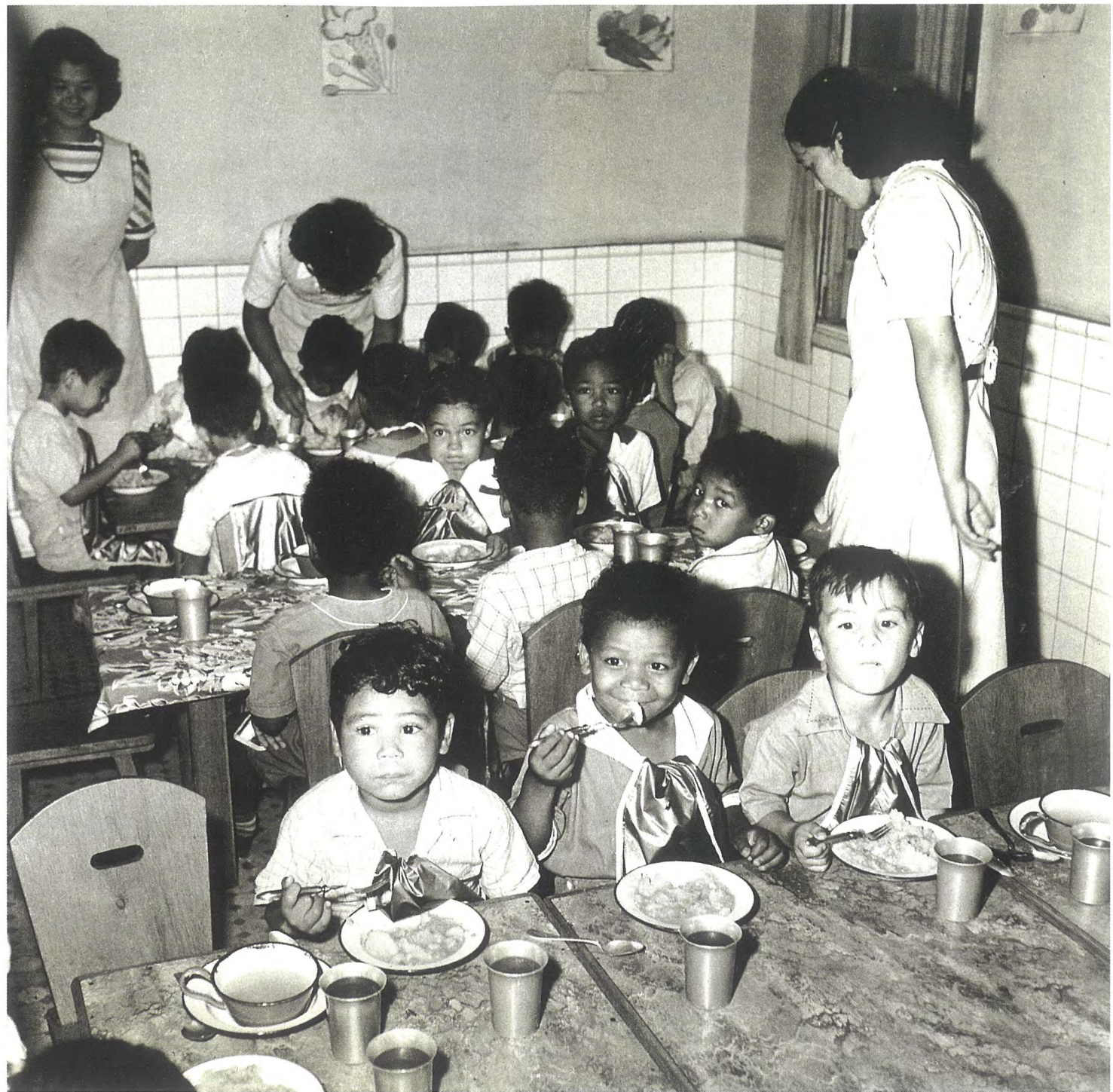
奥村泰宏「聖母愛児園の食堂」昭和27年