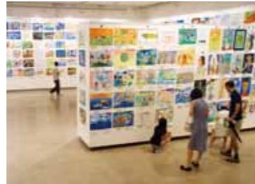
昨年度会場の様子

「横浜市こどもの美術展」は、開館(1964年)の翌年より続く、子どものための夏休みの一大イベントです。横浜市内に在住か在学の小学生以下のお友達であれば誰でも出品できます。元気に満ちあふれた子どもたちの作品で、横浜市民ギャラリー全館がいっぱいになる大迫力の展覧会。「横浜市こどもの美術展」で“作品を見る楽しみ”“作品を見てもらううれしさ”、そしてワークショップで“つくる楽しさ”を実感してください!大人向けにはスペシャルトークもおこないますので、ぜひふるってご参加ください。