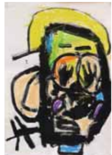
「ステキなママ」 根本拓幹 / 4歳