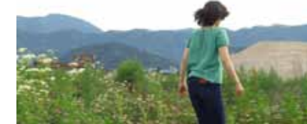
3 | 小森はるか＋瀬尾夏美《波のした、土のうえ》置き忘れた声を聞きに行く》2014年/映像 24分