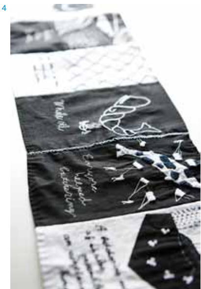
4 | 是恒さくら 原西刺繍『ありふれたくじら』Vol.1(部分)/2016年/布、糸 表面 | 笹岡啓子《PARK CITY》2016年/顔料インクジェットプリント