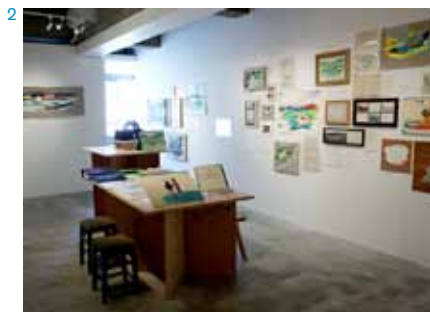
2 | 小森はるか＋瀬尾夏美 巡回展「波のした、土のうえ」in 盛岡展覧会風景/2015年/Cyg art gallery