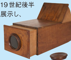
カメラ・オブスクーラ 製作者不詳 1790年頃

横浜市民ギャラリーあざみ野に収蔵されるコレクションのなかから、カメラ・オブスクーラやカメラ・ルシーダ、19世紀後半の風景写真などを展示し、写真と絵画の関係を探ります。