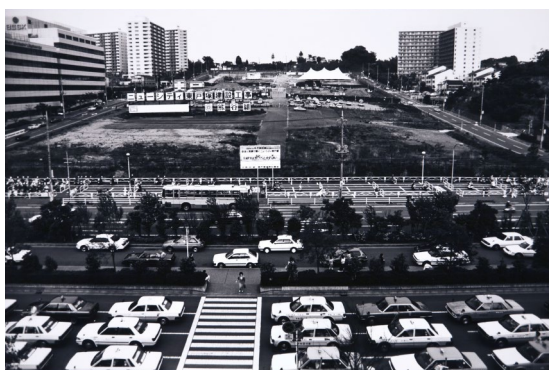
河崎英男《ニュータウン》1988年 セラチン・シルバー・プリント 29.9×45.0cm

今回は、横浜を主題に、戦後1950—1970年代に撮影された五十嵐英壽（1931年生まれ）、奥村泰宏（1914—1995）、常盤とよ子（1930年生まれ）、浜口タカシ（1931年生まれ）の写真、横浜開港120周年にあたる1979年に開催した「横浜百景展」にあわせ制作された素描、1988年に横浜と上海の友好都市提携15周年を記念した「横浜市美術展・横浜百景」の際に撮影された写真、およそ100点を展示し、異なる視点やフレーミングで描き写された作品を通して横浜の風景の移り変わりをたどります。