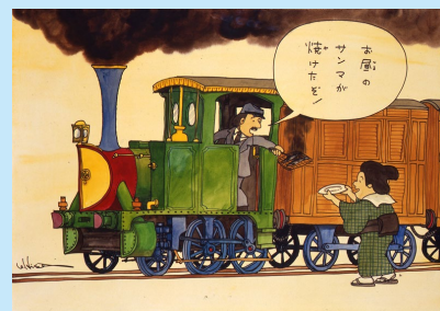
ヒサクニヒコ《SL開通(明治5年)横浜一新橋30K》 1978年 マジック、水彩、紙 72.6×102.4cm

1978年に開催した「ヨコハマ漫画フェスティバル」に出品されたヒサクニヒコ(1944年生まれ)の作品5点とヒサが制作した横浜に関連する作品をあわせて紹介いたします。