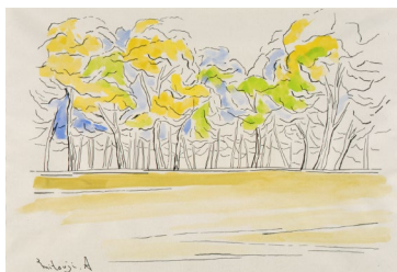
浅生田光司 《常盤公園寸景》 1979年 水彩、マジック、紙 33.1×48.2cm