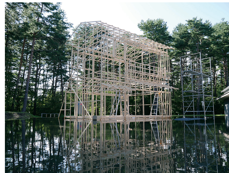
《The House》2016年/木、ビデオプロジェクション/15分/国際芸術センター青森・ACAC