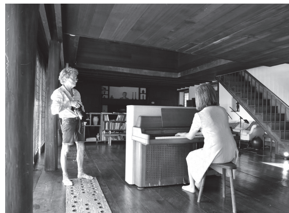
Fig.2 チューニングされたピアノを演奏している様子

資料を読み込んだり、ある事象に関する知識を得たりすることも大切ですが、対話することはもっと豊かなことです。相手の言葉のみならず、振る舞い、ためらい、その時の空気などを含め、対話で得られる情報は非常に多く、大事にしたいと