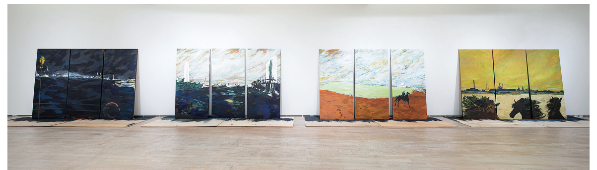
Fig.4 左より《横浜火力発電所》《品川火力発電所》《原町火力発電所》《相馬共同火力発電所》2019年/アクリル、板/展示風景(2019年/アーツ前橋「Art Meets 06 門馬美喜 | ヤムツー」)