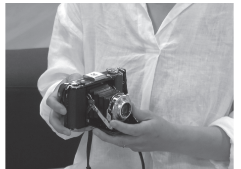
Fig.2 原が使用しているカメラ「イコンタ」

2009年、ニューアート展*1に出品した頃、私は子育てに追われ、撮影は停滞ぎみになりました。写真に集中する時間が取れないことは別に、子育ての豊かさ、そこから得る確かな手応えに比して、写真の作業は曖昧で不安定な取り組みに思えて、その寄る辺なさに耐えられないところがありました。そんな状況の中で、東日本大震災が起きました。今の生活がいつ崩れ去ってもおかしくない脆弱さの上に成り立っていることを感じ、何よりもまず自分の足元のこと、子どもたちの生活を守らないといけないという危機感を強く感じながら過ごしていました。2014年に、ロサンゼルスでのゲティ美術館でのグループ展で作品が展示されることになり、レクチャーの依頼が舞い込みました。*2 写真家としては開店休業状態でしたが、かつての作品によって、写真の世界に引き戻されたと言ってもいいかもしれません。