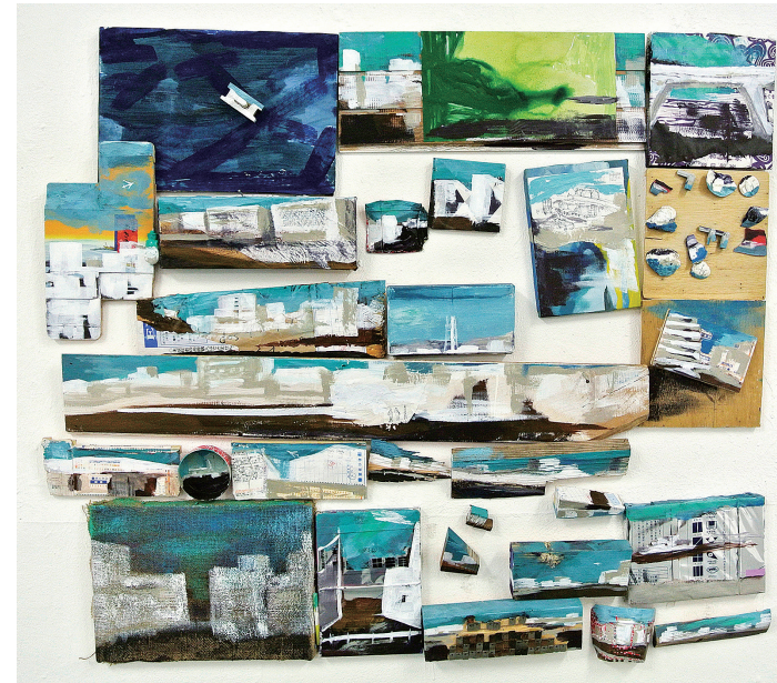
Fig.3 《Route93ヶ月 相馬/大田区■》2018年/アクリル、木材、紙、金属、布、プラスチック、その他