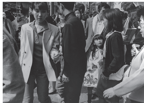
Fig.1 東京総合写真専門学校時代のストリートスナップ、1993年撮影。

このカメラには、曖昧なファインダーしか付いていないので、覗いたままのフレーミングで写るわけではありません。次第にファインダーを覗かずに撮影することが多くなりました。フレーミングに拘らないことを担保に、ある種の自由を獲得したのかもしれませんが。レンズシャッターでピントも目測。フィルムの送りも手回し。操作性は、現行のカメラと比較すると撮りづらいものですが、たまたま出会い、何となく馴染んだこのカメラの選択が、その後の私のスタイルを規定したところがあります。