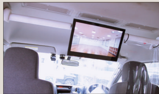
車内に設置されたモニター