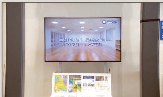
エントランスに設置されているモニター