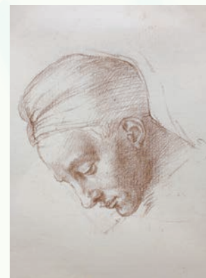
石田淳一(ミケランジェロの素描の模写) 紙、パステル