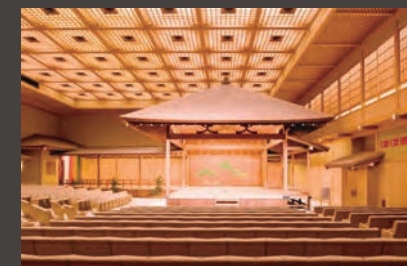
横浜能楽堂本舞台