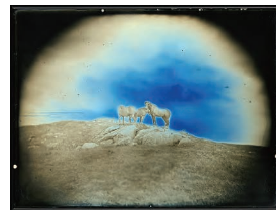
「2011年6月6日 荒川高原の馬」ダゲレオタイプ、25.2 x 19.3 cm、個人蔵

表紙右上作品画像(部分)…「遠野の馬、習作No.3」2013、ダゲレオタイプ、11 x 18 cm、個人蔵