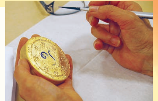
制作風景(実際のサイズとは異なります)

イタリア・ルネサンス期の繊細な古典絵画技法を体験する講座です。 中世の色彩や金の輝き、独特な世界観のある幾何学文様には深い魅力があります。 この講座では、板に金箔(Zecchi製23.3/4kt.)を貼ってテンペラ技法で彩色します。 テンペラ画のデザインは、7世紀頃のCelts(ケルズ)の福音書を参考に制作します。