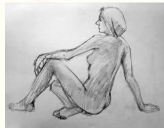
講師作品(クロッキー)

申込締切 4/20(木)必着 ※締切後、当選の連絡を受けた方が講座に参加できます。