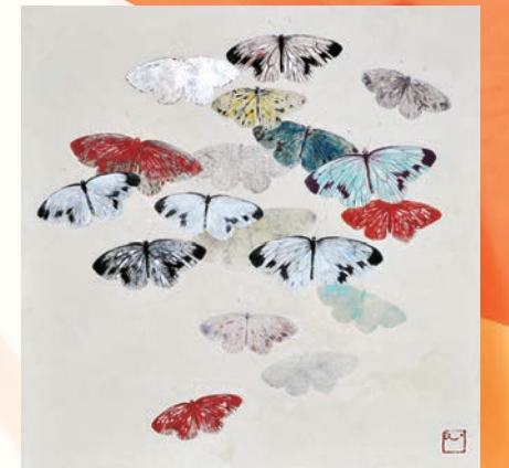
荒木愛(伝言)2012年 和紙、岩絵具、銀箔