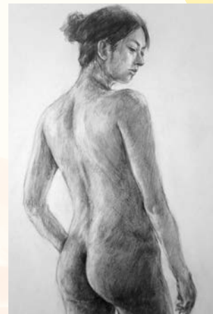
講師作品(デッサン)