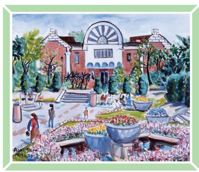
青木四郎《大佛次郎記念館》 1979年/水彩、紙/36.0×44.0cm