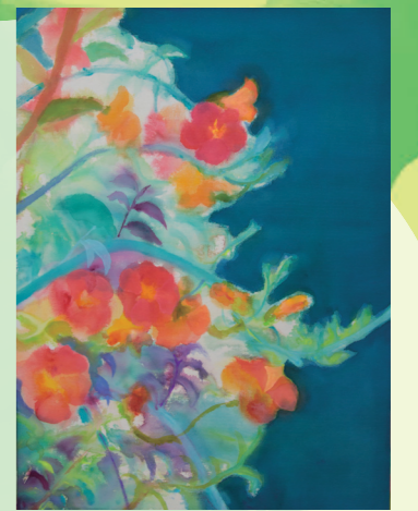
高木彩(Bless)2015年 綿布、アクリル 72.7×91.0cm

講師 高木彩(画家) 対象 15歳以上 定員 25名(応募多数の場合は抽選) 参加費 12,000円(材料費込) 持ち物 スケッチブック(F4以上)、鉛筆、消しゴム 申込締切 5/4(水)必着 ※締切後、当選の連絡を受けた方が講座に参加できます。