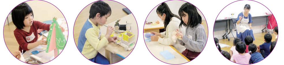
昨年度のハマキッズ・アートクラブの様子

幼児・児童を対象に開催している、描きつくるアトリエ講座「ハマキッズ・アートクラブ」。