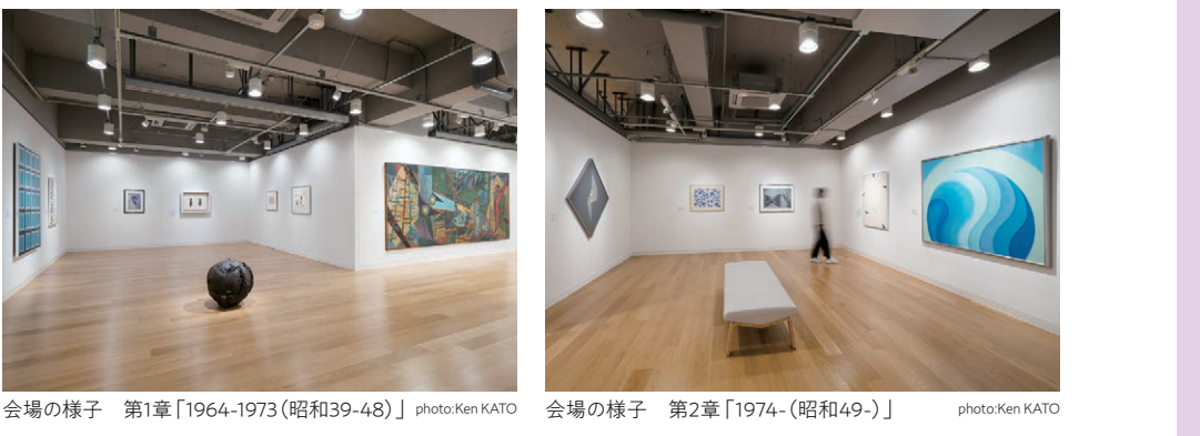
会場の様子 第1章「1964-1973(昭和39-48)」

1964(昭和39)年に開館した横浜市民ギャラリーは、1989(昭和64/平成元)年の横浜美術館開館まで市内の美術施設として中心的な役割を果たしてきた側面があり、そのため当館が企画展や国際展の折に収集してきた所蔵作品には当時―昭和後期の美術史が反映されています。