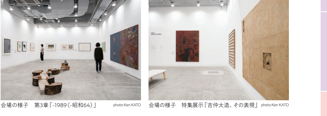
会場の様子 第3章「1989(昭和64)」