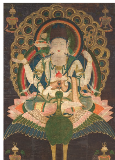
国宝(孔雀明王像) 平安時代後期(12世紀)、絹本着色一軸、1479×989cm 東京国立博物館蔵 展示期間:2019年7月13日(土)~8月7日(水)

催し物ピックアップ 横浜美術館 [最寄駅] みなとみらい線「みなとみらい駅」 JR・横浜市営地下鉄「桜木町駅」 横浜美術館開館30周年記念 生誕150年・没後80年記念 原三溪の美術 伝説の大コレクション 2019年7月13日(土)~9月1日(日) 10:00-18:00 毎週金曜日・土曜日は10:00~20:00 ※入館は閉館の30分前まで 木曜休館 横浜において生糸貿易や製糸業などの実業で財を成した原三溪(慶応4~昭和14)。希代の古美術品コレクター、茶人、アーティスト、そして同時代の日本美術院の画家や彫刻家を物心両面から支援したパトロンとしても知られます。この展覧会では、現在、国宝や重要文化財に指定される名品25件以上を含む三溪旧蔵の美術品や茶道道具150件と貴重な関連資料を展覧することによって、原三溪の文化人としての全体像を描きだします。 ※一部、展示期間の限定される作品がございます。