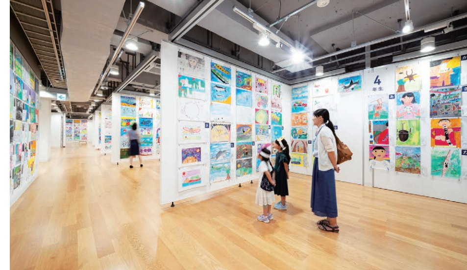
昨年の「横浜市こどもの美術展」の様子

毎年恒例の「横浜市こどもの美術展」をこの夏も開催します。この展覧会は横浜市民ギャラリーが開館した翌年の1965年から始まりました。子どもたちの自由な発想と豊かな表現を育み、健やかな成長を応援することを大切に、半世紀以上にわたって継続しています。