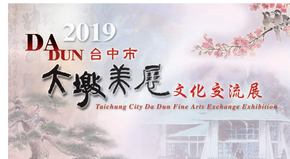
台中市の木(五葉松)、市の花(山桜)、市の鳥(ミミジロチドリ)と台中公園の有名な湖心亭などが描かれている

台中市大墩美展は、芸術において地域、国に差別なしの理念で国際的な作品募集を実行して以来、18年を歩んできました。台中市政府は、本展を台湾の代表的な美術展として位置づけています。墨影画、書道、篆刻、彫影、油絵、水彩、版画、彫刻と工芸品等のジャンルがあり、それらの作品から選ばれた大墩賞受賞作品をはじめ優秀作品を台中市政府の文化局に収蔵しています。国際的な芸術文化交流を促進するために、台中市政府文化局は2007年から大墩美展の所蔵作品を世界各地の美術会場で紹介しています。今回、横浜市民ギャラリーには80点の優秀作品を展示し、芸術文化を通じた国際交流を実現します。