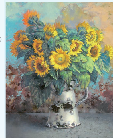
講師参考作品《向日葵》2009年 油彩