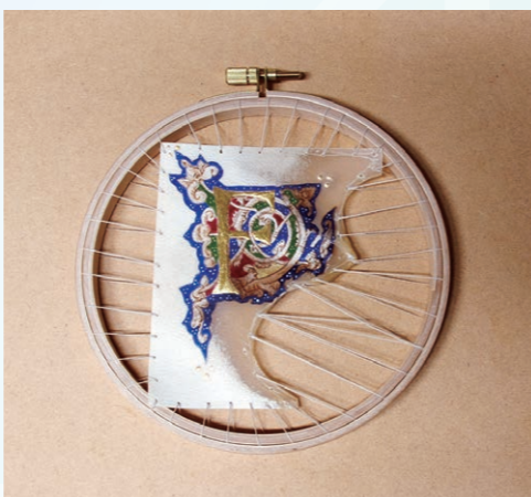
講師参考作品 ※今回のワークショップで制作するサイズ・デザインとは異なります。