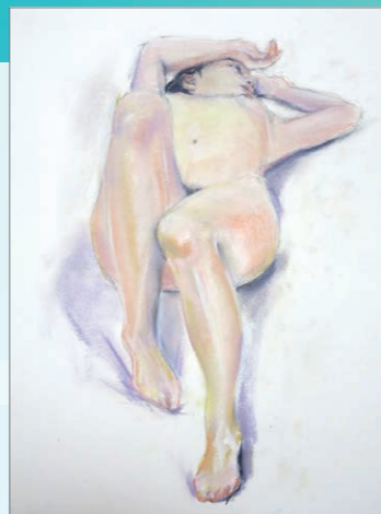
講師参考作品(パステルデッサン)