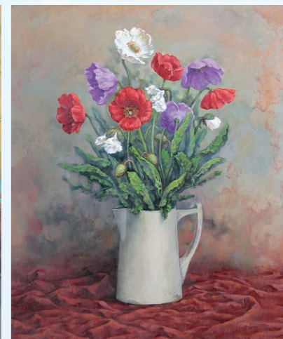
講師参考作品《罌粟》2010年 油彩