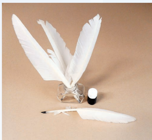
制作で使用する羽根ペンと虫こぶインク