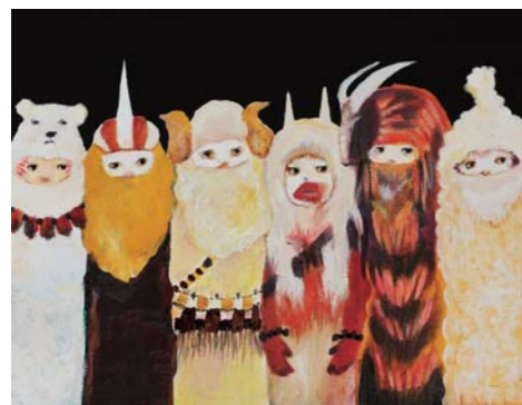
〈ケモノたち〉 2014年 油彩、アクリル、キャンバス 31.8 × 40.9cm