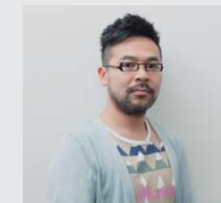
林 正樹 / Masaki Hayashi

ジャズを中心に様々なフィールドで活躍し、情感あふれる演奏が人気のピアニスト・林正樹。今回は展示室にグランドピアノを設えて、田中千智の絵画に囲まれながら音楽を堪能できる一夜限りのスペシャルライブを開催します。アルバム「El retratador」の楽曲に加え、田中の作品から着想を得た新曲が披露されます。田中千智と林正樹の贅沢なコラボレーションにご期待ください。