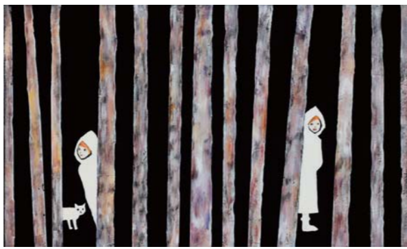
〈かくれんぼ〉 2014年 油彩、アクリル、キャンバス 27.3 × 45.5cm

「ニューアート展NEXT」は、「創造都市横浜からの発信」というテーマのもと、横浜と関わりのある気鋭の若手作家を紹介している展覧会です。3回目となる今回は、画家・田中千智の個展を開催します。