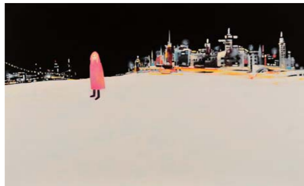
〈天使エスメラルダ〉 2013年 油彩、アクリル、キャンバス 80.3 × 130.3cm