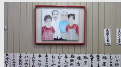
「107人のポートレート」展示風景 2008年 黄金町バザール(神奈川)

田中千智が2008年の黄金町バザールで制作した「107人のポートレート」の一部を黄金町で再び展示します。